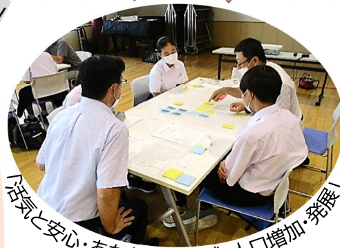
「活気と安心・あたたかい地域・人口増加・発展」