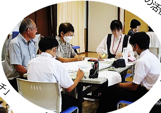
「ここは自然の宝庫!!」