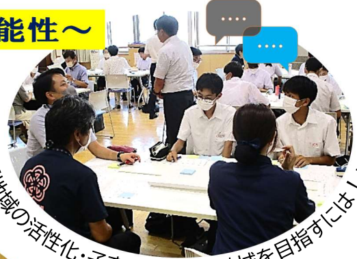
「地域の活性化・子育てしやすい地域を目指すには!!」

★「にっこり笑顔であいさつ♪」「あいさつの声が飛び交うまち♪」と魅力ある小須戸地域になるためには、とても大切で一番の近道!!