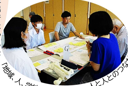
「地域、人、学校との関わり合い・人と人とのつながり」