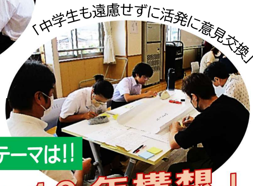
「中学生も遠慮せずに活発に意見交換」