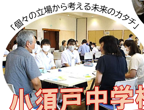
「個々の立場から考える未来のカたち」