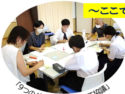
「9つのグループに分かれて協議」

★「にっこり笑顔であいさつ♪」「あいさつの声が飛び交うまち♪」と魅力ある小須戸地域になるためには、とても大切で一番の近道!!