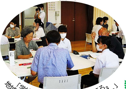
「学校を核に地域で人材を育てる。地域の人とあいさつをし、顔見知りになる。」