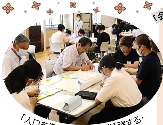
「人口を増やす・中学生が活躍する・暮らしやすい環境整備」