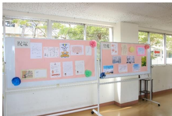
↑ たくさんのお祝いのことばをいただきました

内野中学校で出会った仲間たちと共に、たくさんのことを学び、豊かな学校生活を築き上げ、未来への可能性を広げていくことを誓って、誓いの言葉といたします。