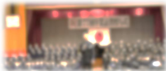
卒業合唱「旅立ちの日に」

3月5日(火)、内野中学校第77回卒業証書授与式が行われました。今年の3年生279名がそれぞれの進む道に向かって巣立っていく瞬間でした。卒業証書授与では、校長先生から3年生一人一人に卒業証書が手渡されました。返事をして、卒業証書を受け取る3年生の立ち振る舞いは堂々としていて立派なものだったと思います。最後には、卒業合唱として「旅立ちの日に」を3年生が歌いました。その歌声は、これから自分たちが進む道を力強く歩こうとする思いのこもった素晴らしいものでした。毎年行われる卒業式ですが、卒業する3年生にはそれぞれの積み上げてきたものがあり、ストーリーがあります。令和5年度の3年生も、内野中学校の伝統を受け継ぎ、立派な足跡を残したのではないかと思います。内野中学校のバトンは、在校生に託されました。令和6年度の内野中学校も大きく飛躍することを期待しています。校長先生が、卒業式で読まれた式辞の内容を紹介します。