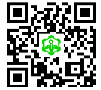
鳥屋野小学校 ホームページ

5月9日に令和6年度第1回 学校運営協議会（コミュニティ・スクール 通称CS）が鳥屋野小学校多目的室にて開催されました。