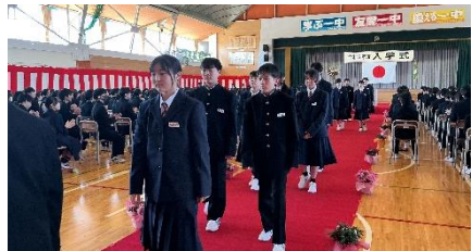
◆ 新入生退場の様子 ◆