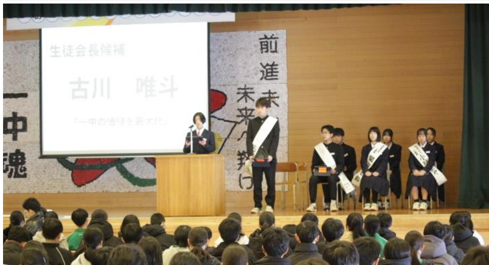
立会演説会 候補者・責任者の演説

先日、来年度の一中のリーダーを決める、生徒会役員選挙を行いました。感染症等の影響で、一週間遅らせての実施となりました。 選挙期間中は連日、候補者、責任者、協力者の生徒が玄関前に立ち、呼びかけを行ってきました。選挙・立会演説会当日も、それぞれの候補者が自分の公約や来年度の一中に対するビジョンを力強く述べました。 毎年、一中の生徒会は学校をよりよくするための公約を掲げ、それを実現するために積極的に活動しています。昨年度の「ふれあいルーム」の開設、今年度の「創立五十周年記念企画」の実施など、先生方や地域の方からもアドバイスをもらいながら、実現してきました。まさに自主的で自治的な活動といえます。 来年度も、先輩方から一中の伝統を引き継ぎ、さらに一歩前進した生徒会活動になることを期待しています。