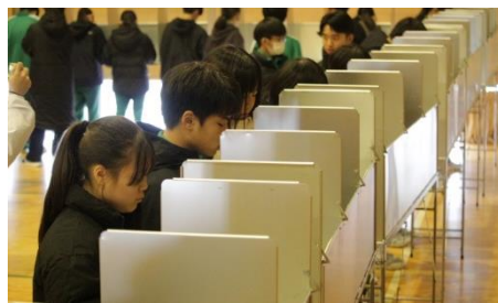
本物の記載台、投票箱を使っでの投票