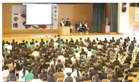
立会演説会のようす