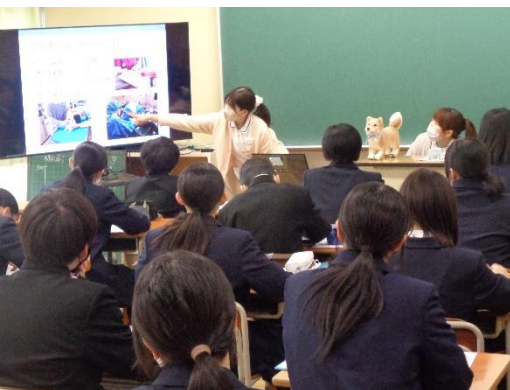
◆スライドや犬のぬいぐるみを使って説明する白根動物病院の看護師さん◆