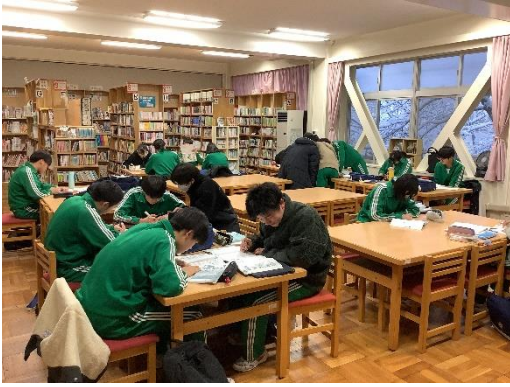
◆定期テスト前日の 5 日（水）放課後、図書室で学習する 3 年生◆

テスト期間に入っています。三年生は、先週六、七日に終了しました。三月に高校入試を控えている生徒もたくさんいますが、中学校生活最後の定期テストに全力で臨む姿が見られました。直前の質問教室や学習室として開放されている図書室には大勢の生徒で賑わっていました。間もなく卒業を迎える三年生の「学び姿」を後輩に示すことで、「学び一中」の伝統を引き継ぐことにもつながります。今週の木曜日からは、一、二年生のテストです。今年度の総まとめとして、しっかりと学習に向き合います。