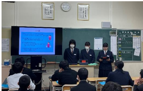
タブレットを使って上手にまとめました

十二月三日(火)に三年生は「生き方講演会」、二年生は「職場体験学習発表会」を実施しました。これは、南区の支援事業である「未来創造教室」の公開授業として行われ、当日は、南区教育支援センターの小菅所長や広報課の方も来校されました。三年生は、講師をお招きして会話やコミュニケーションについて講演いただき、二年生は、七月に実施した職場体験学習の学習成果を一年生も招いて発表しました。どちらもとても有意義な時間になりました。