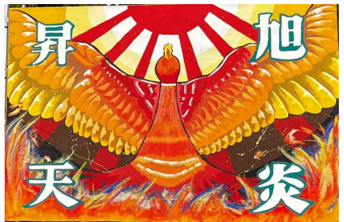
赤連合【太陽に上る不死鳥】