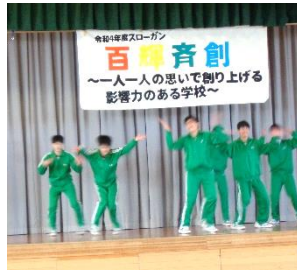
【2/9 3年生ダンス発表会】 保体の成果を発表。本格的！