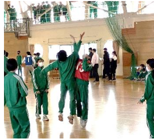
【2/8～10 生徒会球技大会】優勝 男子:3-4 女子:1-3