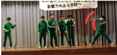
【1/17 2年生 The 1st Live】 特技や演芸を堂々と披露