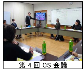
第4回 CS 会議

6年生を送る会が2月21日(金)に行われました。また、2月13日(木)から21日(金)の期間は『6年生ありがとう週間』ということでいろいろな催しが行われました。