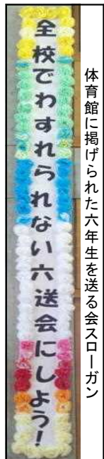
体育館に掲げられた六年生を送る会スローガン

14日には6年生の思い出特集ということで、6年生一人ひとりが6年間の思い出を話してくれました。それを動画に撮り、給食時間に全校が視聴しました。その他に、5年生が中心となって『ワイワイタイム』を実施したり、1～5年生が書いたメッセージを、5年生がまとめて、6年生へのプレゼントを作り渡したりしました。“全校でわすれられない六送会にしよう！”のスローガンのもと、5年生が全校をリードして『6年生を送る会』『6年生ありがとう週間』を企画運営しました。来年度の大淵小学校のリーダーとしてとても頼もしく感じました。