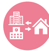
関係機関と 連携した支援