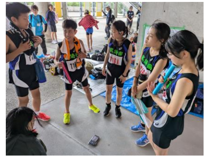
【レース前の作戦会議】

12名の選手たちは、励まし合い、協力して練習に励み、大会に向けて自己記録を更新してきました。当日は、全日本の選手権大会も開催された競技場で、他校のアスリートたちと実力を競いました。5年生男子100Mで さんが10位に入賞したのを始め、たくさんの自己新記録が生まれました。