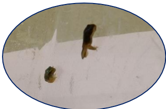
カエルになりはじめたおたまじゃくし