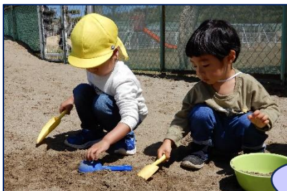
友達の姿を見て、「やってみよう！」