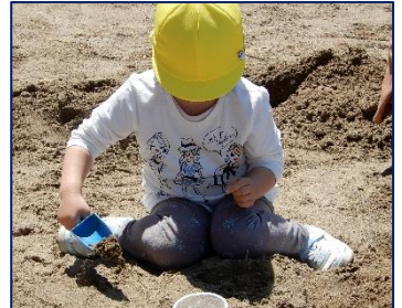
このカップはできるかな？