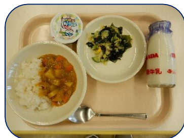
今日はカレー！ こどもの日ゼリーも出ました！