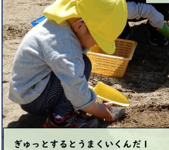
ぎゅっとするとうまくいくんだ！

「こうするとおもしろいよ。」…子どもたちのワクワクのきっかけにそうした説明はありません。遊ぶ中でそばにいる友達の姿から気付いたり、自分なりに試行錯誤したりして、「もっとこうしてみようかな。」「次はもっとうまく作りたい。」という意欲が高まっていきます。この過程に「学び」があります。「遊び」＝「学び」です。