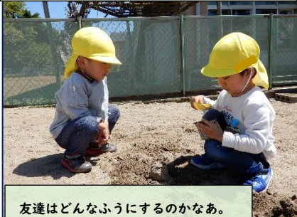
友達はどんなふうにするのかなあ。