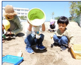
さっきよりもできた！ケーキみたい！