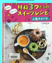
『材料3つからのスイーツレシピ』