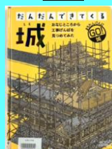
『だんだんできてくる城』