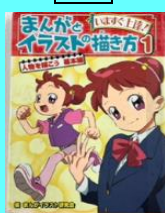
『まんがとイラストの描き方』