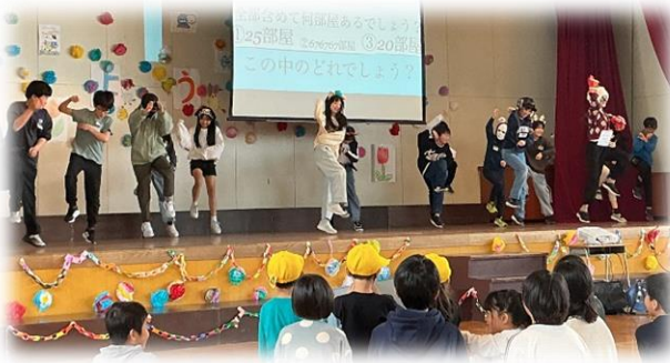
5年生がクイズとダンスで盛り上げてくれました