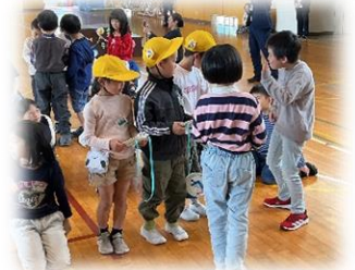
2年生はプレゼントを作って 渡してくれました