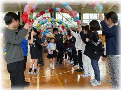
4年生が花のアーチで迎えてくれました