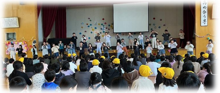
3年生は児童会の歌とダンスを見せてくれました