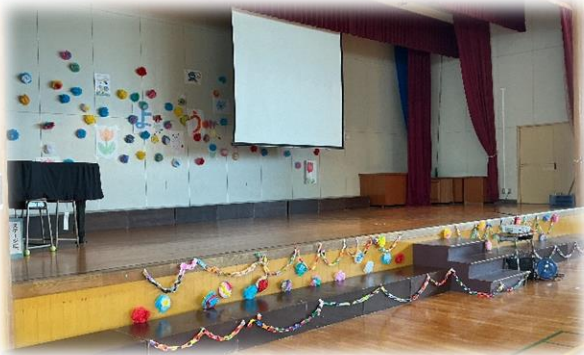
6年生によるステージの素敵な飾りつけ