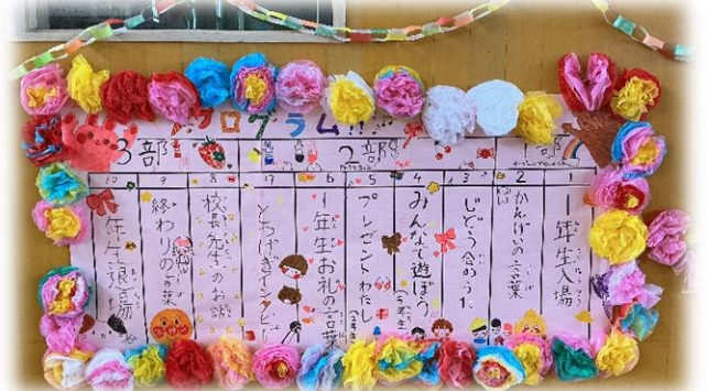
プロジェクト委員会がプログラム製作