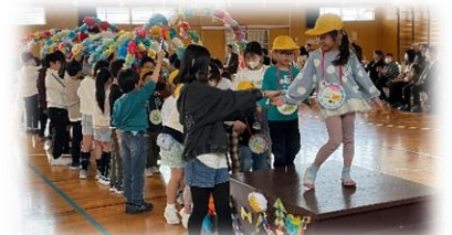
6年生と一緒に退場しました