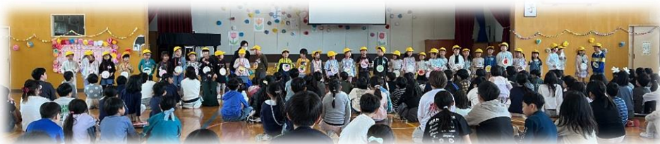
1年生はみんなでお礼の言葉を伝えました