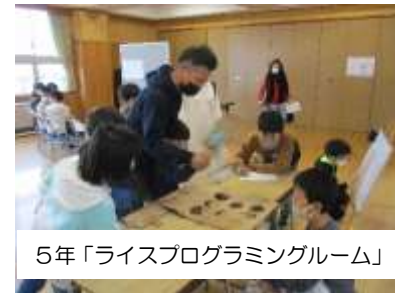
5年「ライスプログラミングルーム」