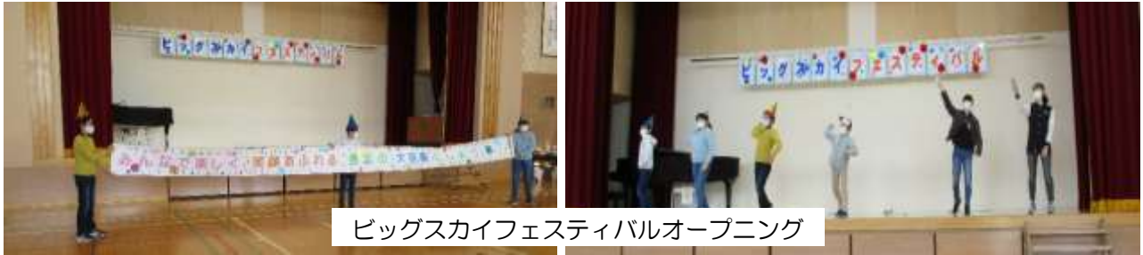
ビッグスカイフェスティバルオープニング