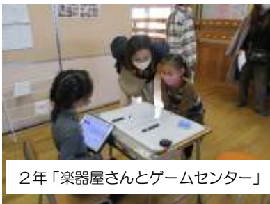
2年「楽器屋さんとゲームセンター」