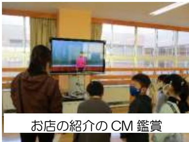
お店の紹介のCM鑑賞

今年のスローガンは「みんなで楽しく笑顔あふれる最高の大空祭にしよう」でした。子どもたちは、店員とお客に分かれて楽しみました。保護者の皆様、たくさんお越しいただきありがとうございました。