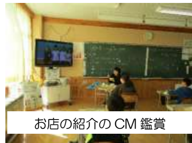
お店の紹介のCM鑑賞