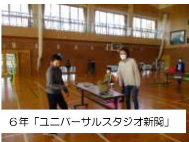
6年「ユニバーサルスタジオ新聞」