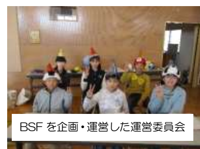
BSFを企画・運営した運営委員会