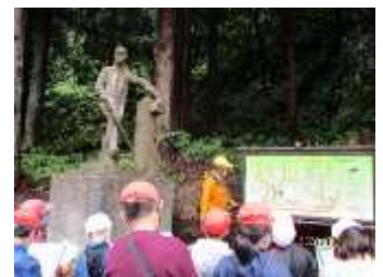
3・4年総合「新関のたから」

さて、新関小学校では、6年生が「総合的な学習の時間」で新関地区のよさを調べ、発信する活動に取り組んでいます。(詳しくは新関小学校のブログをご覧ください。)また、2年生「町探検」や3・4年生「新関のたから～川とともに歩んだ新関人～」でもそれぞれに地域学習をたくさん取り入れています。