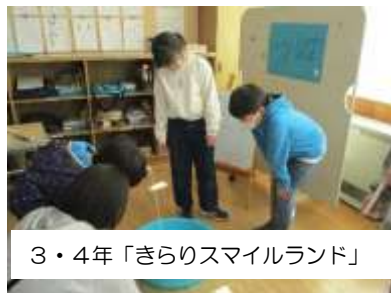
3・4年「きらりスマイルランド」