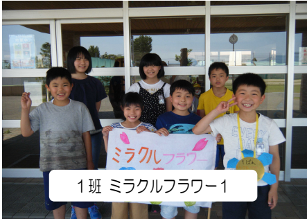
1班 ミラクルフラワー1