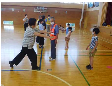
「1年生子ども体験型安全教室」