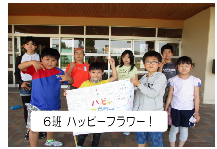
6班 ハッピーフラワー!