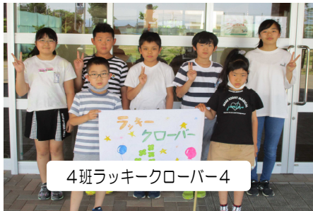
4班 ラッキークローバー4