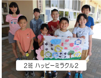
2班 ハッピーミラクル2