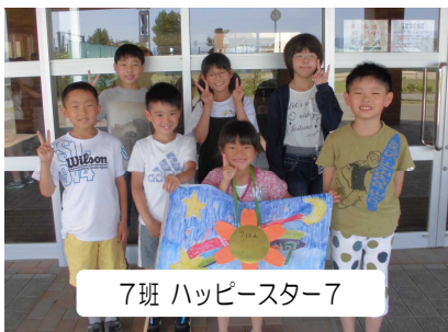
7班 ハッピースター7