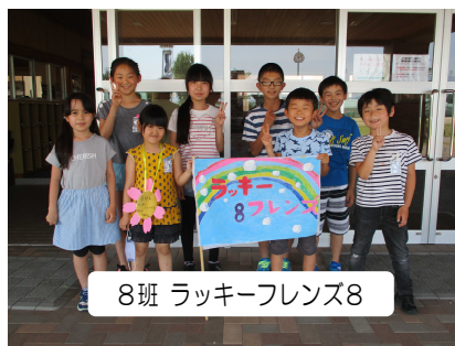
8班 ラッキーフレンズ8

1年間、学校行事、児童会行事、清掃など大空班で楽しく活動しながらメンバー同士の絆と異学年のつながりを深めていきます。