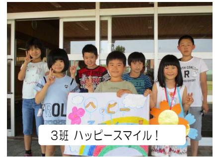
3班 ハッピースマイル!