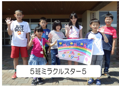
5班 ミラクルスター5