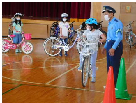
「3, 4年生交通安全教室」

『 子どもの身を守り、命を守るにつながる 』は, 第一の十分な安全の担保を踏まえた上で, 行うべき重要なことです。当校では, 5月末の「3, 4年生の交通安全教室(自転車教室)」を皮切りに, 6月には2日間に分けて密を避ける形での「避難訓練」を, 16日(火)にはベル訓練や「1年生の子ども体験型安全教室(不審者対応訓練)」を実施しました。コロナ禍の最中ではありますが, これらの行事や活動を通して, 子どもたちは命や身体を, 自ら守るすべや大切さを学んでいきました。