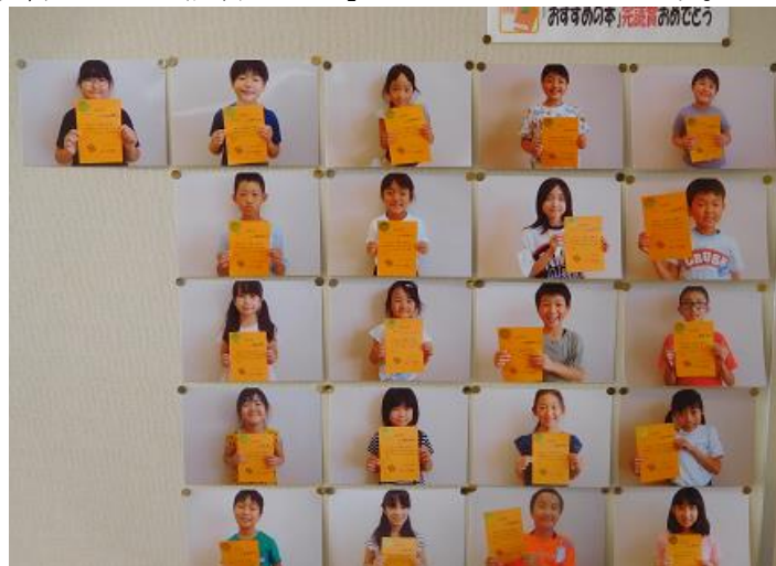
7月末まで21名が、『おすすめの本』を完読しました。

校長室の壁には、完読した子どもたちの顔写真が、完読した順に貼ってあります。全校59名の顔写真で埋め尽くされるのを楽しみにしています。