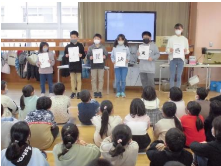
「今年の一語」の発表