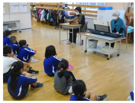
「朗読あきは」さんによる読み聞かせ