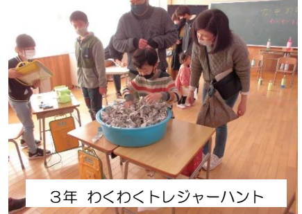
3年 わくわくトレジャーハント