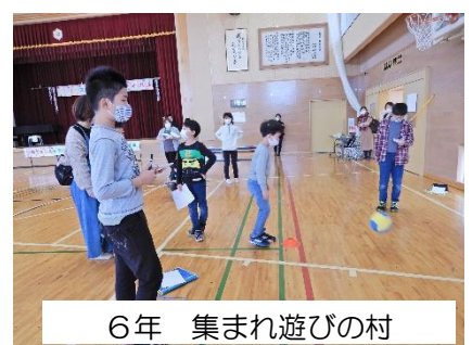
6年 集まれ遊びの村