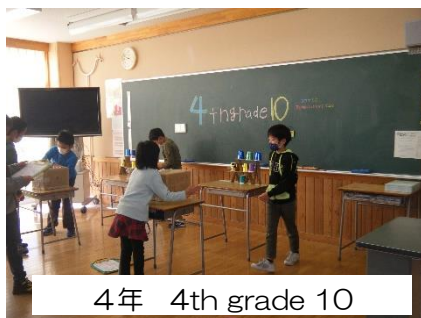
4年 4th grade 10