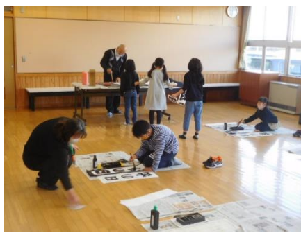
地域ボランティアによる書き初め指導