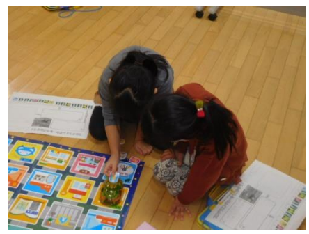
1学年プログラミング授業