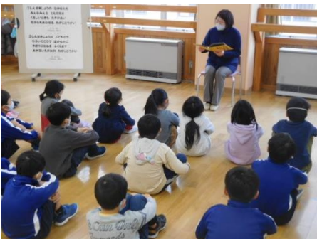
「朗読あきは」さんによる読み聞かせ