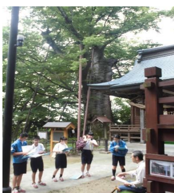
岡方中学校 岡方探訪