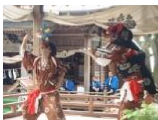
岡方第二小学校 伝統芸能 神楽舞