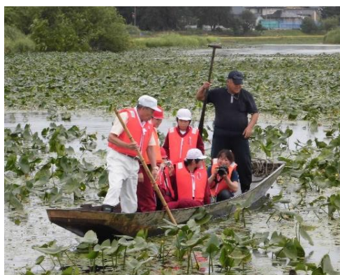
岡方第一小学校 十二瀬学習

さらに、2～3か月に1度、岡方地区3校のコーディネーターでも集まり、各校の活動の報告等の情報交換をしています。通常、地域について学ぶ際、どなたにどういったお話を伺ったかなど、それぞれの学校で依頼して、終わってしまいがちですが、3校の地域教育コーディネーターが情報を共有しあうことで、学校にも、子どもたちにも、お世話になる地域の方にも有意義になるようこれからも連絡を密にし、協力しながら頑張ります！どうぞよろしくお願いいたします。