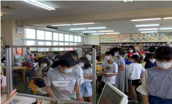
↑ 休み時間、カウンター前にはたくさんの借りる人の長い列が！

6/27 (月) ~ 7/1 (金) の期間、読書週間を行いました。1日1回、図書館に本を借りに来るとスタンプがためられるカードを全校に配りました。期間中、図書館は大せいきょうで5日間の貸し出し冊数は3,322冊でした。スタンプをためると次の週に、賞品の引きかえができました。プラス2冊多く本を借りたり、しおり作りができたりました。たくさんの参加をありがとうございました！