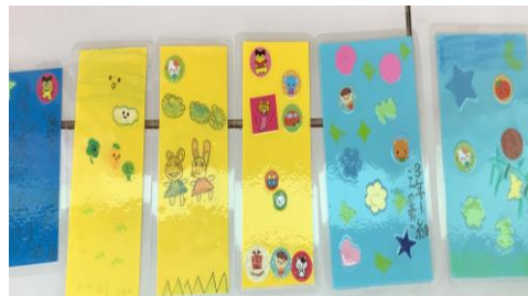
←スタンプを4ポイント以上ためた人はオリジナルのしおりを作りました。

各学年のおすすめの本の完読者(～7/8 現在) ※クラスの中で完読した順番に紹介しています。