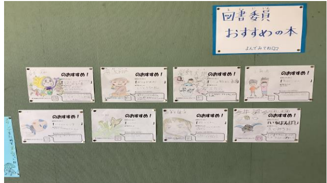
↑ 児童玄関前に図書委員のおすすめの本の紹介コーナーをつくりました！