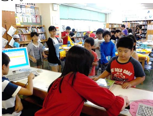
カウンターはながぎょうれつ長い行列ができました。

としょかん 図書館まつりでは、た く さ ん の か 人が本を借りたり、イベントに さんか に参加したりしてくれ、とてもにぎわいました。これから、読み終わったら自分で図書館に来て、心に残る本をたくさん見付けてください。