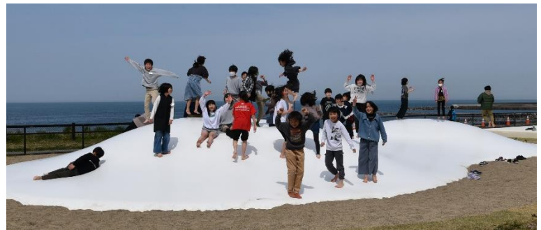
自然観察の後クラスみんなでふわふわドームを初体験

今年度、日和山小学校は創立10周年を迎えます。記念式典はもちろん、各行事も少し特別なものにしていきます。しも町の歴史の上に立つ日和山小学校であるからこそ、開校当時の地域の皆様の思いを振り返るとともに、これからの日和山小の学びを見いだしていく1年にできるよう取り組みます。しも町で、しも町を、しも町と学ぶ「しも町学」の充実を図るとともに、その一環となるハマベリング!!!へも参加し、子どもたちの学びを全員参加の豊かなものにしていきます。